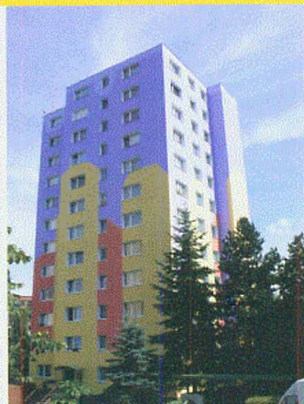
Věžový bytový dům na sídlišti Broumovská je příkladem nevěšedního ztvárnění a barevného řešení fasády.