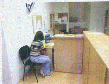
Zákazníkům je kancelář k dispozici v pondělí a ve středu.

I díky tomuto vítězství ve výběrovém řízení roste počet družstev spravovaných bytových i nebytových jednotek. Zájem o správu bytů není jen ze strany obcí, ale zejména ze strany soukromých subjektů, ať již malých bytových družstev nebo společností vlastníků jednotek. V současné době spravuje SBD Sever cca 7,3 tisíce bytů a 1,3 tisíce garáží a dalších nebytových prostor.