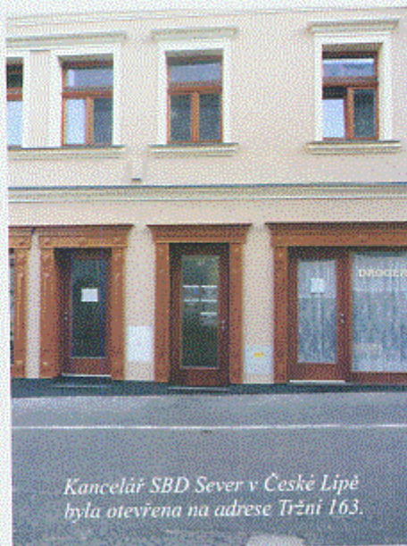
Kancelář SBD Sever v České Lípě byla otevřena na adrese Tržní 163.

V souvislosti s uzavřením této smlouvy otevřelo Stavební bytové družstvo Sever svou kancelář v centru České Lípy. Kancelář je pro potřeby nájemců bytů otevřena každé pondělí a středu.